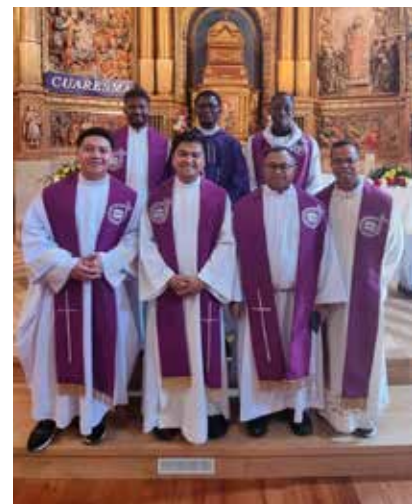
Los Misioneros del Verbo Divino presentes en la Javierada.