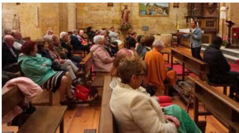
La exposición bíblica en Zamora.

blicos. Da la impresión de que no hay hábito de lectura y, consecuentemente, que el nivel de interpretación bíblica, de diálogo entre Biblia y vida, es limitado.