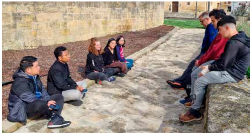
El grupo durante la convivencia después de Javierada.