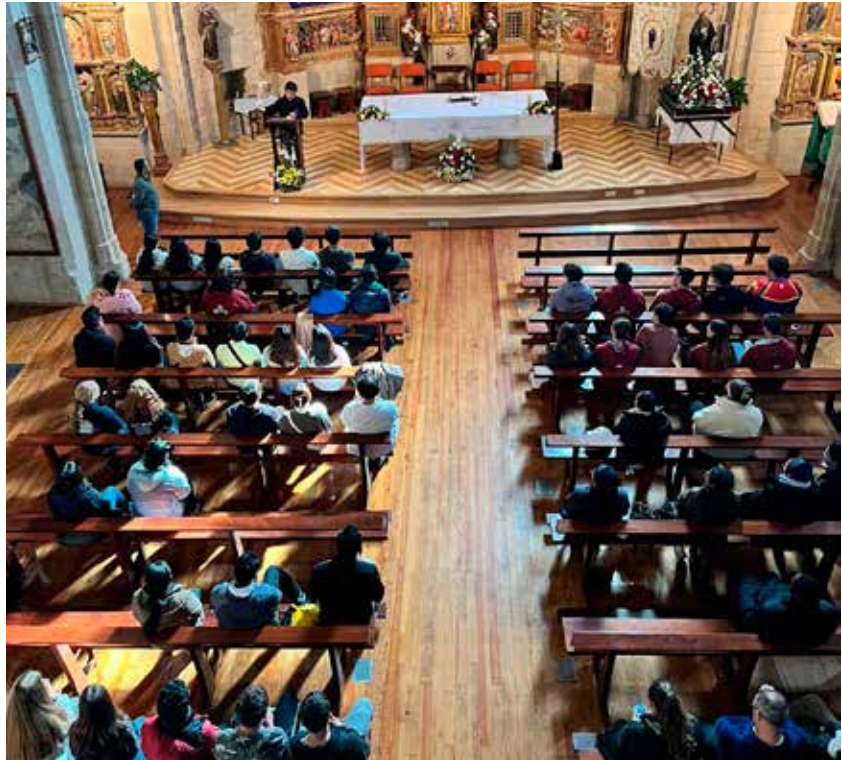
La misa de acción de gracias en la Iglesia de Nuestra Señora de la Asunción en Villatuerta, Navarra.

Esta experiencia única de Javierada no solo reafirmó la fe y el compromiso de cada uno de los peregrinos, sino que también subrayó la importancia de la comunidad y el apoyo mutuo en el camino de fe. El éxito de este encuentro fue posible gracias a la colaboración de colaboradores laicos SVD en varias parroquias, así como de las hermanas de las Misioneras SSpS y los cohermanos SVD, demostrando una vez más que el espíritu de misión y comunidad trasciende fronteras y une corazones.