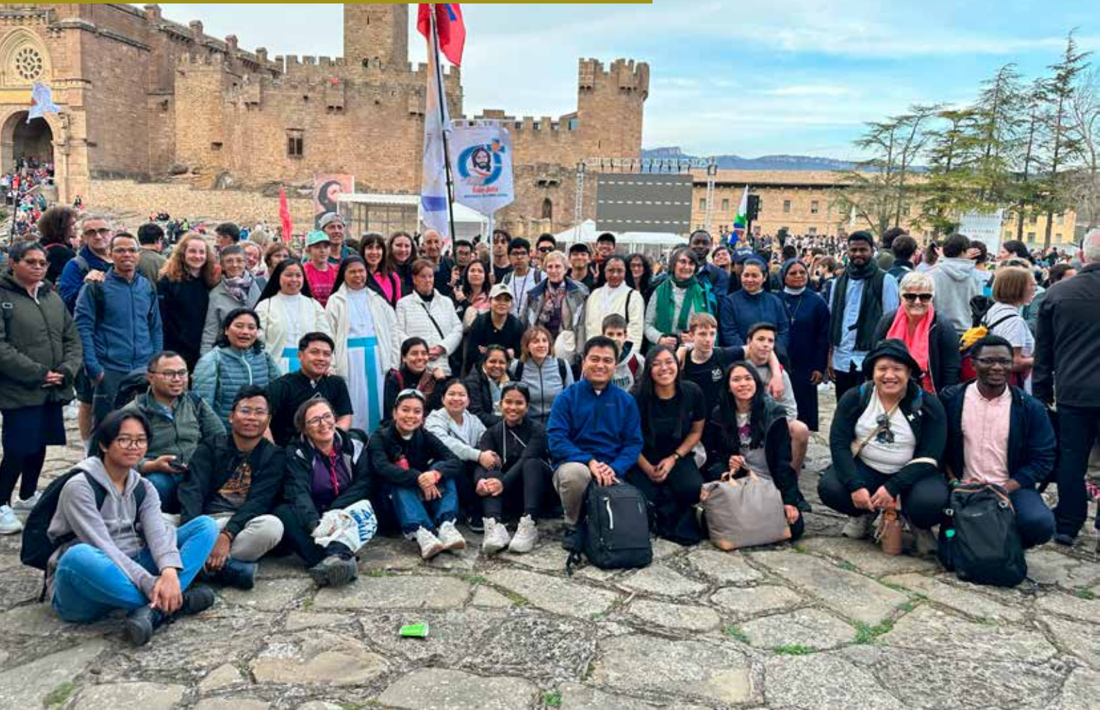
La delegación de las parroquias de los Misioneros del Verbo Divino en la Javierada, el 16 de marzo de 2024.