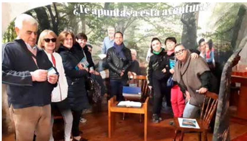
La exposición bíblica en Cabezón de Pisuerga, Valladolid.

Hay un aspecto que me gustaría resaltar: el ambiente de un cierto «analfabetismo bíblico» en nuestros entornos pastorales. Esto lo percibo en mis encuentros con la gente cuando les doy retiros y cursos bí-