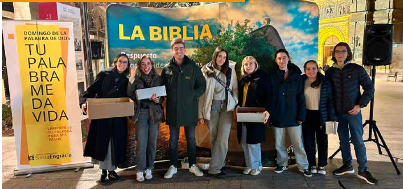
La exposición bíblica en Zaragoza.