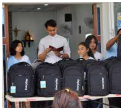
Entrega de material escolar a los niños de la parroquia.

Comencé a pedir ayuda a los hombres para arreglar pequeñas cosas. Así, la renovación de la iglesia comenzó con la formación del «departamento de mantenimiento». Tanto los aldeanos budistas como los católicos siempre estaban listos para atender el llamado a hacer buenas obras, o méritos según la costumbre budista.