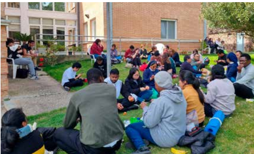
La visita de los grupos parroquiales a la casa de los Misioneros del Verbo Divino en Estella.