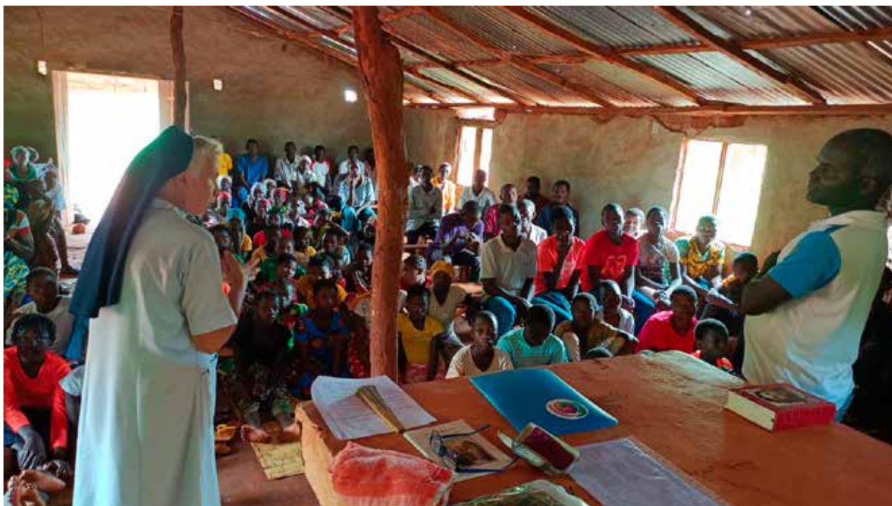
Las hermanas de la congregación Misioneras Siervas del Espíritu Santo impartiendo la catequesis a la comunidad parroquial.