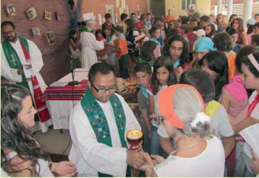
Encuentro anual de misioneros y amigos SVD en Dueñas