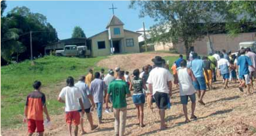
“Nuestro deber como Iglesia es trabajar para proteger el medio ambiente”

(Los Misioneros del Verbo Divino en la Región de la Amazonía luchan contra los que destruyen el medio ambiente; defienden a las comunidades, si es necesario, de los líderes locales y ejecutivos corporativos).