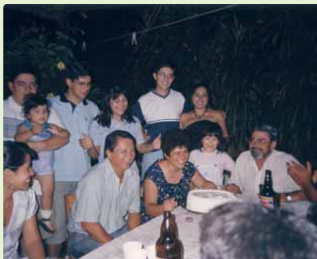
Los “brasiguayos” son muy responsables y comprometidos

La vida política sigue como siempre. Promesas y más promesas de los políticos, que se llevan sus buenos sueldos, y el pueblo sigue esperando... Con Lugo se inició el cambio: sanidad gratuita para todos incluidos los medicamentos, y sin privilegios para unos pocos... Pero la alegría dura poco en la casa del pobre. Estamos espe-