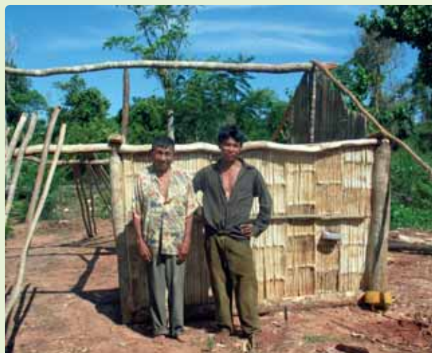
La gente va abriendo caminos y construyendo sus ranchos

las, no bastaban para poder vivir. Los productos eran muy pocos y no podían comercializarlos. Los que los comercializaban, “los acopiadores”, se quedaban con gran parte de la ganancia, por lo que aquellos se vieron obligados a venderlas. Así, los campesinos se convirtieron en vendedores ambulantes en las ciudades fronterizas de Paraguay y Brasil. Esta situación perdura hasta hoy.