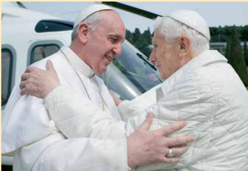
El papa Francisco visita al papa emérito Benedicto XVI

Me han pedido que escriba unas líneas sobre el nuevo papa Francisco visto desde América Latina, y sobre las expectativas que ha podido crear el hecho de que sea precisamente latinoamericano. Pues bien, pienso, en primer lugar, que una clave importante para entender esas expectativas es el hecho de la dimisión del papa Benedicto XVI. Sorprendente, pero a la vez lógica desde el amor a la Iglesia, como él mismo lo expresó. Fue una señal clara de que podía venir algo fresco en unos momentos de tantos problemas y reclamos dentro de una Iglesia que pedía nuevos rumbos. Así se despertó con fuerza la esperanza de que el resultado de la elección del nuevo Papa podría responder, al menos en parte, a ese anhelo. Y así fue. Aquel “buona sera” del cardenal Bergoglio, de Buenos Aires, al saludar a la multitud en la plaza de San Pedro, presentándose sencillamente como obispo de Roma y pidiendo la bendición a sus feligreses, vestido de blanco