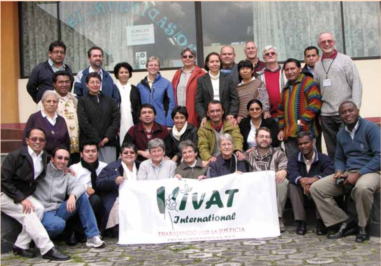
VIVAT Internacional, ONG que lleva a la ONU las causas de los pobres

VIVAT Internacional es una de las 4.000 ONGs (Organizaciones No Gubernamentales) que colaboran con las Naciones Unidas. Los objetivos humanitarios de VIVAT son: Desarrollo sostenible; Erradicación de la Pobreza; Mujeres; Cultura de la Paz.