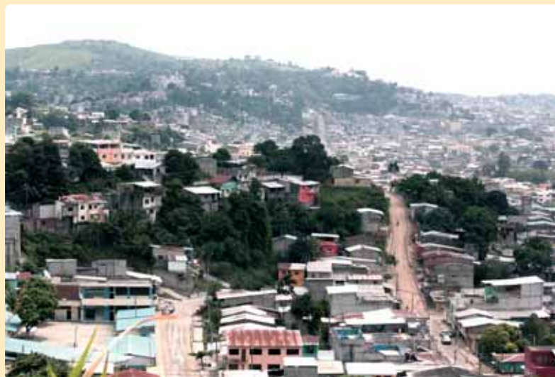
Ciudad de Esmeraldas, Ecuador

(Fernando Villanueva, s.v.d., Esmeraldas – Ecuador)