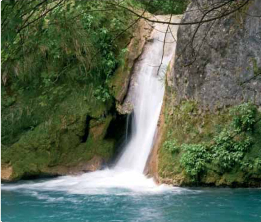
Nacedero del río Urederra, Tierra Estella

La Biblia es para los cristianos un inagotable manantial de agua fresca capaz de saciar la sed de quienes, “peregrinos” en marcha, la consideramos fuente inspiradora de nuestra misión y compromiso de bautizados. Herramienta por excelencia para entender y asumir la historia de la salvación, va perfilándonos un Dios bondadoso, cercano a nuestra realidad que, sin exclusión, nos ama a todos y respeta nuestra singularidad.