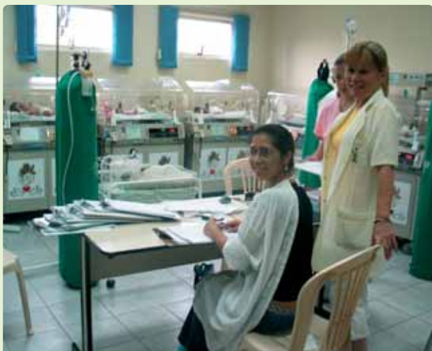
Maternidad en la Ciudad del Este (José Fernández)