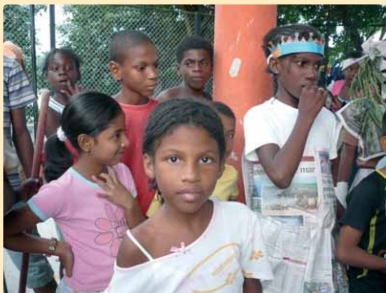
Belleza y esperanza en los rostros