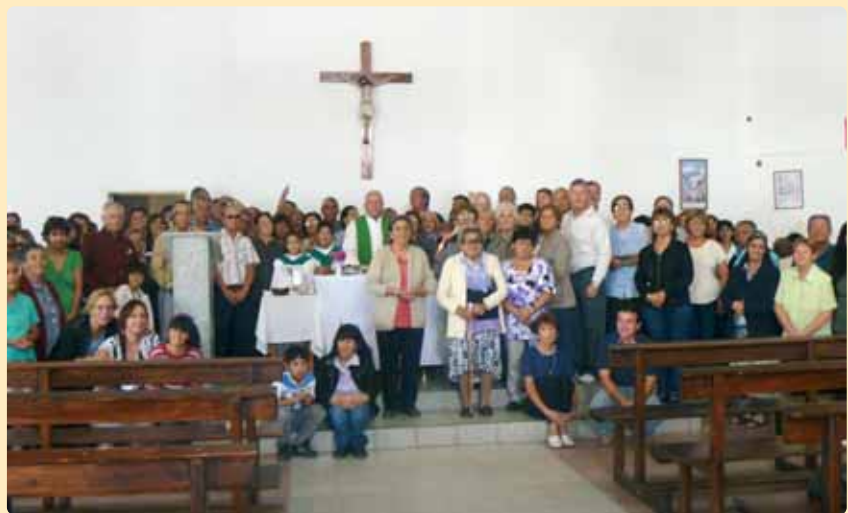
Parroquia de Cutral-có, Neuquén, Argentina

no orar la vida diaria. En medio de tantas actividades, situaciones difíciles... separaciones de familias, muertes repentinas, suicidios... es necesario darse un tiempo de silencio y reflexión, y muchas veces no lo tenemos. Las dificultades venían también desde dentro de la propia comunidad religiosa, porque la falta de comunicación y de diálogo lleva al enfrentamiento y al aislamiento en la vida, aboca a un individualismo dañino y contraproducente. Con los años, aprendes a ser más tolerante y a mirar a los otros con ojos más fraternos, respetando la riqueza personal y las diferencias.