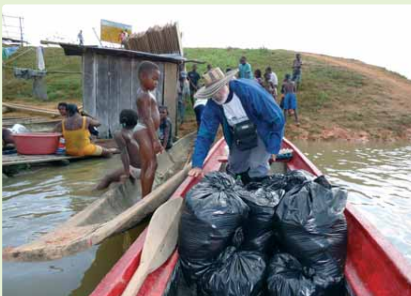
El río Atrato y la piragua