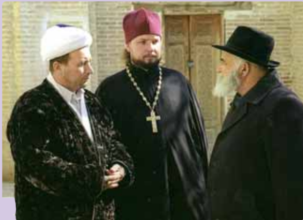
Diálogo entre musulmán, cristiano y judío

“La Iglesia, a partir del Concilio Vaticano II, ha avanzado en cuanto a la comprensión de su misión en relación a las demás religiones. Según la teología conciliar, la Iglesia no está al servicio de sí misma, sino al servicio del Reino del Dios. Esta misión la lleva a cabo a través del testimonio, la oración, la catequesis, mediante el diálogo y el anuncio explícito de Jesús y su mensaje. Comenzando, en primer lugar, por reconocer que hay elementos de verdad y de salvación en todas las religiones, lo que no exime de la responsabilidad de anunciar a Cristo.