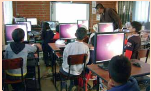
La informática ha llegado a Yanallpa

Los estudiantes de YANALLPA reciben los elementos básicos del conocimiento y de la vida, de la cultura y de la historia. Con la ayuda de mucha gente de fuera del lugar, se complementa y refuerza la enseñanza con una buena alimentación. No se descuidan tampoco otras actividades complementarias, como pueden ser el aprendizaje y conocimientos de informática, de