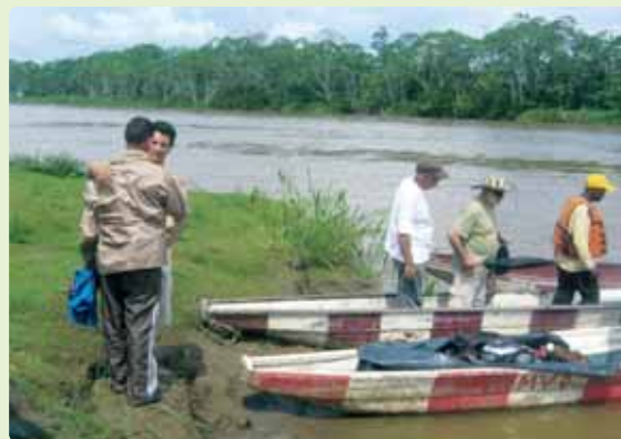
Listos para visitar las comunidades