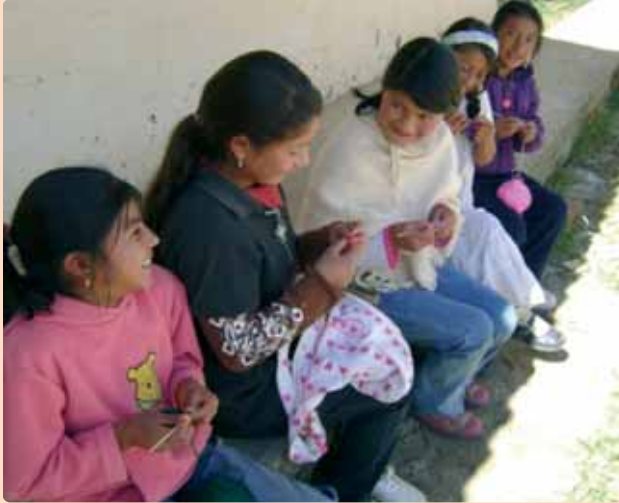
Niñas aprendiendo a tejer la vida