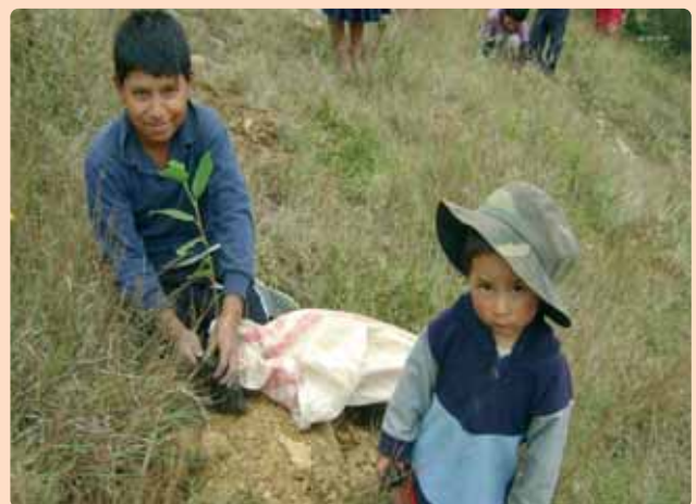
Niños plantando un arbolito

costura y confección. Se les enseña también a cultivar huertos y plantar árboles frutales. Se pone todo el empeño en hacer realidad el dicho de que la inversión en educación es la más rentable de un país.