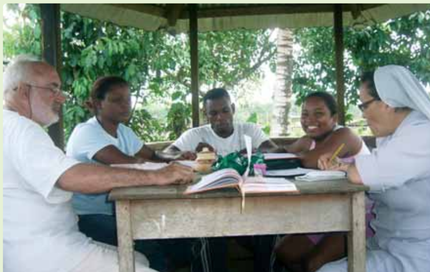
Planificando las actividades en equipo