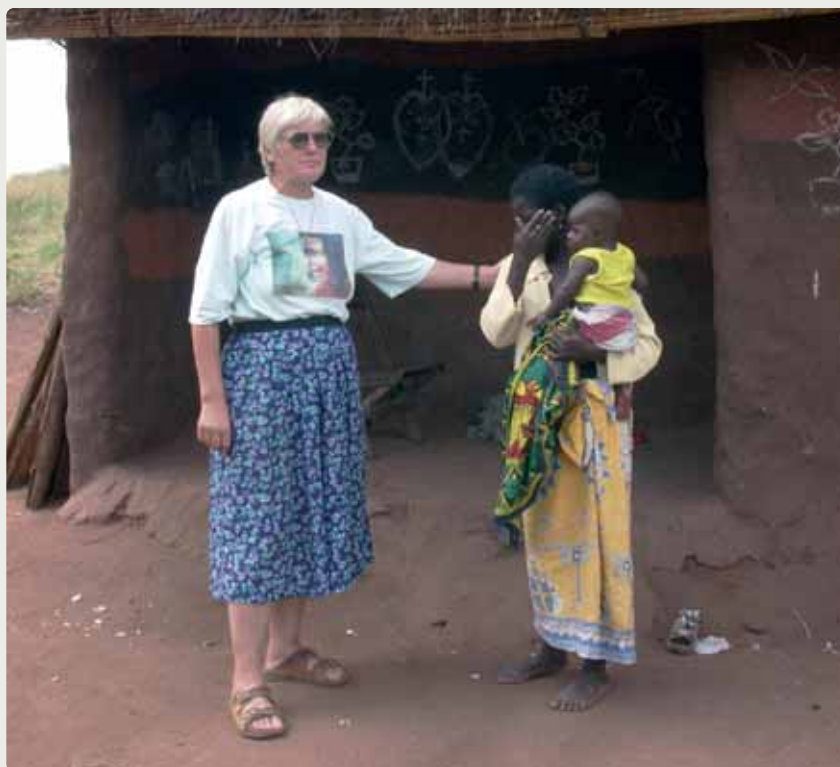
Una misionera visita a una madre en su casa

Pero el lugar clave para la transmisión y la vivencia del Evangelio es la casa. Jesús, en su instrucción misionera a los discípulos, señala la acogida de los enviados del Maestro en las casas (Mt 10; Mc 6,7-11; Lc 9,1-6; 10,1-16). Lo sugiere Lucas al contar la visita de Jesús a la casa de Marta y María (Lc 10, 38-42). La instrucción de Jesús a los setenta y dos discípulos tiene como marco privilegiado la casa. “Cuando