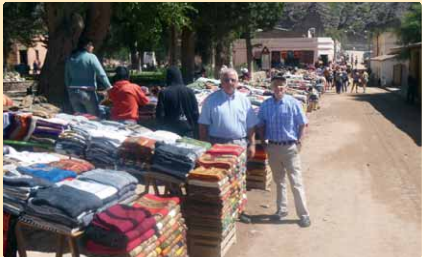
Tejidos de Bolivia, en un mercado de Jujuy, Argentina

Las dificultades, el cansancio, la rutina pastoral... vienen de la falta de alimentación interior... de