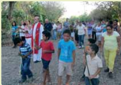
Procesión en Playa Hermosa, Costa Rica