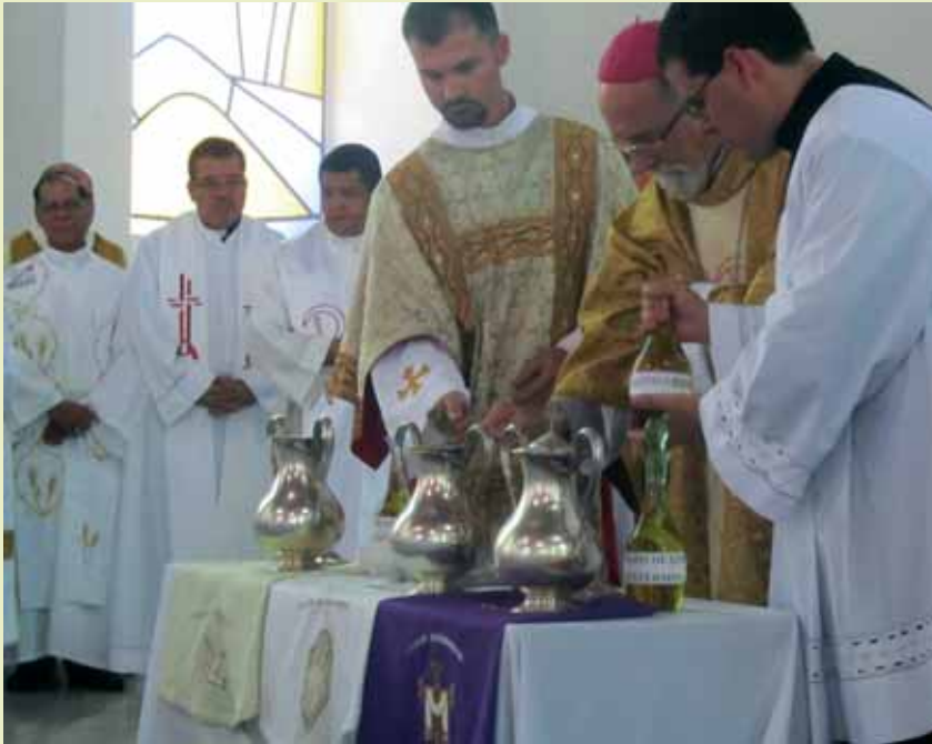
Bendición de los Santos Óleos