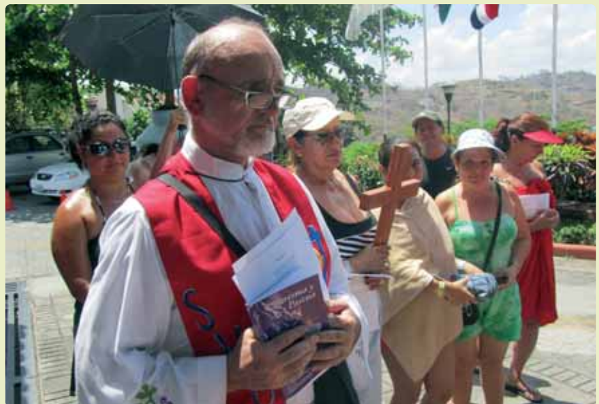
Domingo de Ramos en Costa Rica

fiegan. Para el Vía crucis, el “cura” con sus paramentos litúrgicos, y los vecinos participando en la colocación de las estaciones, la que le toque... y durante dos horas la playa se paraliza para recor-