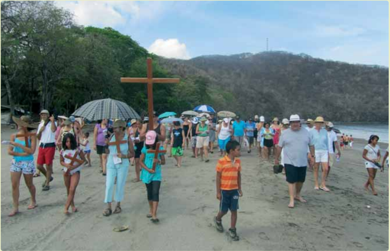
Vía crucis en la playa