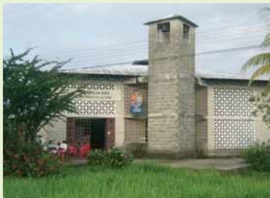
Iglesia de Vigía del Fuerte (Chocó)

Desde hace mucho tiempo, Colombia se reconoce como país pluricultural y multiétnico. Donde vivo (Vigía del Fuerte, en el río Atrato), la población es en un 89% negra, 7% indígena y 4% mestiza. La geografía es también muy variada. Siendo, en extensión, el doble que España, Colombia tiene prácticamente los mismos habitantes. Eso indica que hay mucho terreno sin habitar, normalmente por las dificultades de