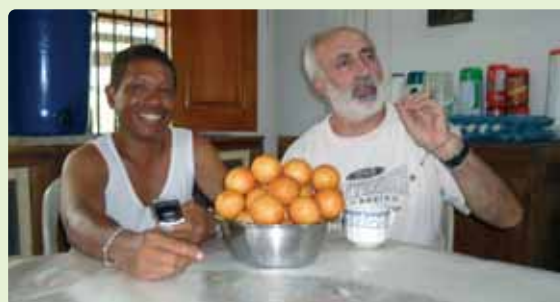
El misionero está al día y merece su salario

Tenemos la suerte de trabajar en una Diócesis comprometida con la defensa de la vida y los derechos humanos. Es un lugar muy apropiado para vivir nuestra dimensión, como verbitas, de justicia, paz y defensa de la creación.