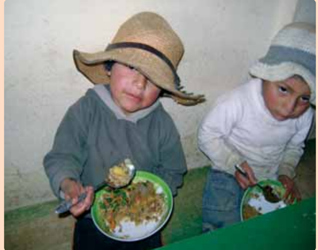
Parece que quieren compartir su comida