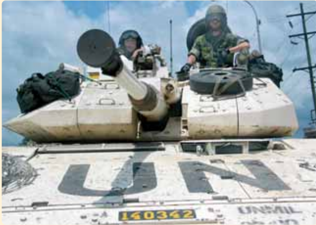
Misión pacificadora de los cascos azules