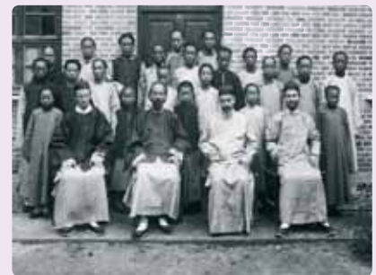
Seminaristas y profesores antes del comunismo en China

año 1949, todo el territorio era atendido pastoralmente por los Misioneros del Verbo Divino. A partir de ese año, con los comunistas en el poder, se fue destruyendo y borrando todo vestigio religioso, el gobierno confiscó los bienes de la Iglesia y hasta las tumbas de los misioneros fueron profanadas. En estos últimos años el clima se ha vuelto más calmado y el gobierno es más tolerante con la religión. Los católicos y los cristianos de otras Iglesias pueden ser atendidos espiritualmente por sacerdotes y pastores. El último obispo de Yanzhou fue Zhao Fengwu, fallecido en agosto de 2005 a la edad de 85 años. El 20 de mayo del presente año se ha conseguido el permiso del gobierno chino para que, con autorización del Papa, fuera consagrado como sucesor y nuevo obispo de Yanzhou, antiguo Yenchowfu, el joven sacerdote Lu Peisen, lo que no deja de ser una buena noticia para la Iglesia de China.