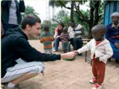
Dos mundos se dan la mano

niños es el lugar donde poner las bases y desarrollar esa sociedad. El centro escolar trata de ser autosuficiente y de gestionar sus propios recursos materiales y humanos. Para un estado del bienestar en el que todas las personas puedan disfrutar de los mismos derechos, la sanidad juega un papel fundamental. La novedad en este sentido ha sido el servicio de 24 horas que han abierto para la maternidad.