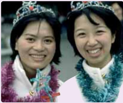
Universitarias de la Fu Jen