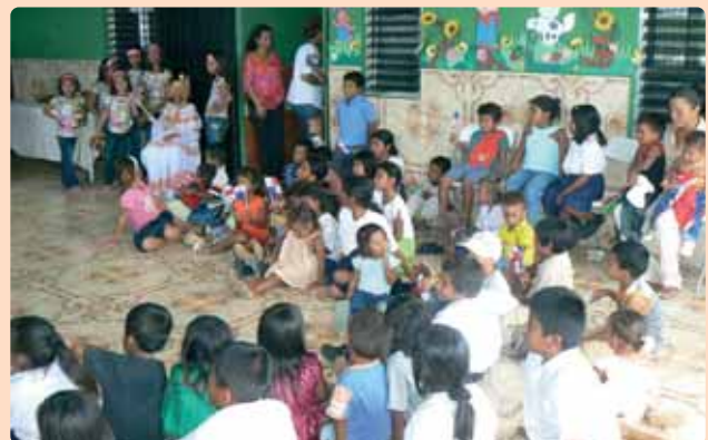
La fiesta de los niños