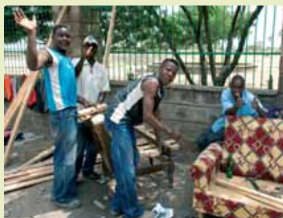
Trabajo es salud y alegría

“Cuando llegamos a Kenia nos alojamos en el seminario de los Misioneros del Verbo Divino, a pocos kilómetros de Nairobi, en una comunidad de religiosos de 10 nacionalidades distintas, de África, Asia y América. Sensibilidades diferentes en una sola familia. Todos intentaron que nos sintiéramos como en casa, atentos siempre al más mínimo detalle. Conviviendo con los 24 jóvenes seminaristas, a uno le llama la atención la internacionalidad, la diversidad de lenguas y, a la vez, la profunda comunión. En un futuro serán sacerdotes, y alguno vendrá a sembrar esperanza a Europa.