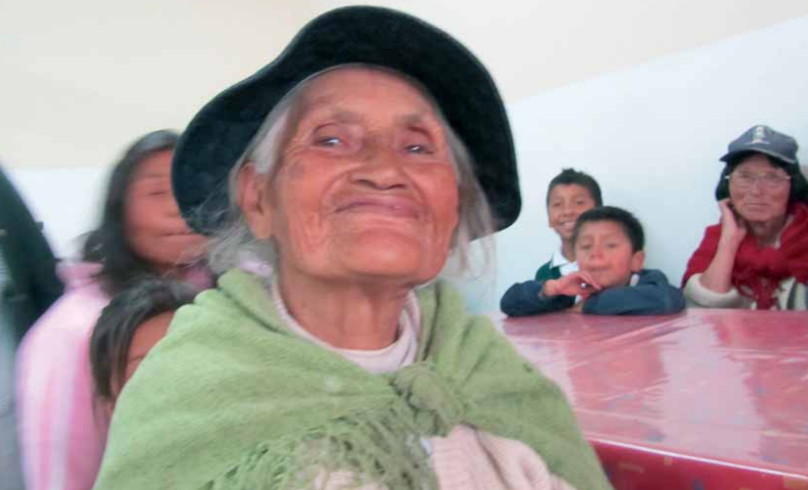
Rostros de la Chiquitanía boliviana