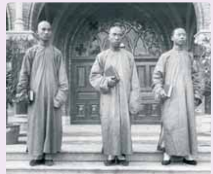
Teólogos chinos Svd

Shandong, China, fue la primera misión confiada a la Congregación del Verbo Divino en 1882. Los primeros misioneros enviados por Arnoldo Janssen fueron Juan Bautista Anzer y José Freinademetz. En los años siguientes fueron llegando otros misioneros que marcaron la historia del Verbo Divino y de la Iglesia en China. En 1885 Juan Bautista Anzer fue nombrado obispo de Yenchowfu –hoy Yanzhou–. En aquellos años de finales de siglo diecinueve y hasta el