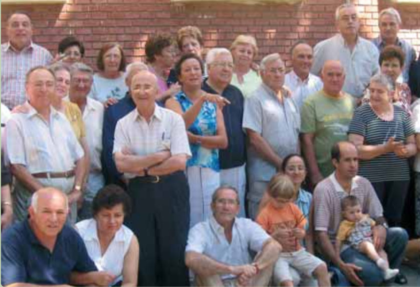
Misioneros con sus familias en Dueñas