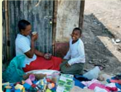
Manos vacías pero el corazón lleno

Personalmente, este viaje ha permitido que parte de mi corazón se quede en África. Gracias a esta experiencia he conocido una realidad que ahora me incumbe. He podido tocar la pobreza y ver la felicidad del que tiene la décima parte de lo que yo tengo. Hay necesidad de muchas mejoras técnicas e industriales y un reparto más equitativo de las riquezas, pero poseen una fortuna que convierte a Occidente en un mundo por desarrollar: la alegría de vivir. He podido comprobar también el abrazo que Dios lanza a este continente a través de la Iglesia, no hay más que ver la vitalidad de sus parroquias y su elevado número de fieles y su espíritu de hermandad y de saber compartir lo que tienen”.