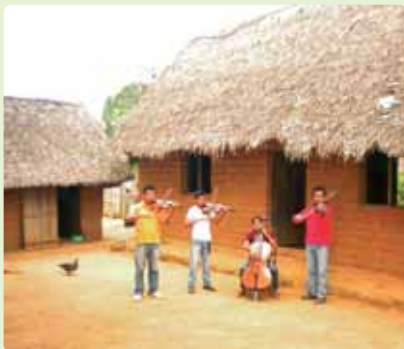
Casa de Urubichá, escenario y lugar de ensayo

Con dos horas de retraso conforme a lo previsto llegábamos a Urubichá a eso de las 8 de la noche, porque a partir de las 6 ya es de noche. Allí estaban las niñas y niños esperándonos sentaditos, formales, cantando, rezando, la iglesia abarrotada y de nuevo el corazón impresionado y latiendo a ritmo desordenado. Y cuando empezamos la misa para la que estaban esperando, la iglesia se llenó con aquellas canciones de cuaresma cantadas por tantas voces que parecían una sola salida de mil gargantas. El tema: La alegría del encuentro. Y la reflexión: Gracias, Señor, por el milagro de la vida, de la naturaleza, de la amistad. Y es que Urubichá, desde hace ahora dos años, para mí se ha hecho parte de mi vida.