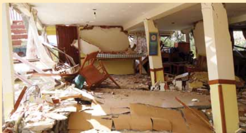
Así quedó la residencia de los Misioneros del Verbo Divino

EL ALTO, de inmediato se movilizó la Comunidad Verbita, personal y alumnos de CINCA, personas de la Parroquia Santa María de los Ángeles y amigos, para colaborar en el “rescate” de muebles y enseres que duró días porque las lluvias impidieron rea-