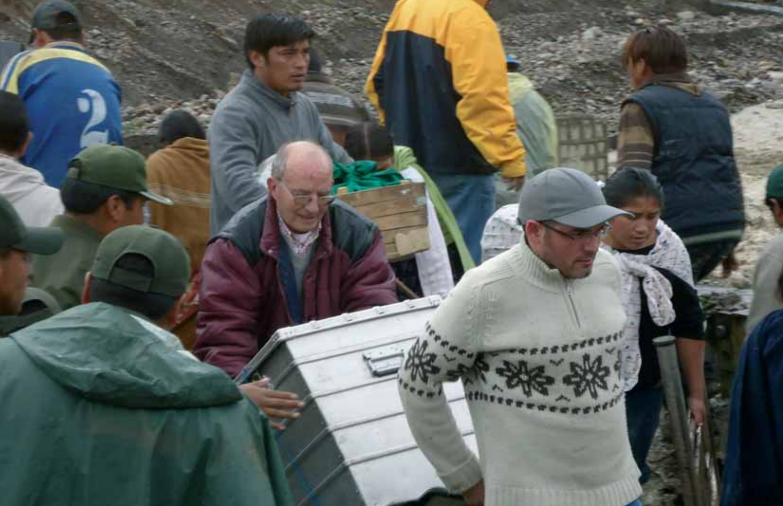
Solidaridad cuando más se necesita

sacar nada ”, se lamentaba, rodeada de hijos y nietos.